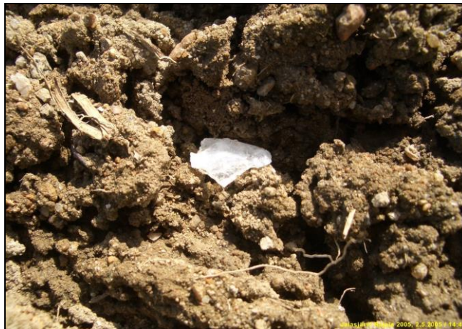
Kvartsi-iskos "in situ" Rajalan pellossa

Huomiot: Rajalan talon eteläpuoliselta peltorinteeltä löytyi harvakseltaan kvartseja. Maaperä paikalla on moreeni, ylempänä hiekkainen alempana peltorinteessä hiesuisempi. Kvartsien keskittymä vaikutti painottuvan n. 30 m pellon reunasta etelä-kaakkoon. Peltorinteen laelta löytyi vain yksi kvartsi. Löydettyjen kvartsien joukossa on yksi kvartsiesine ja yksi esineen katkelma. Talon itäpuoliselta pellolta, kymmenisen metriä pellon reunasta itään, alarinteeseen löytyi muutama kvartsi. Peltorinteen yläpuolella ja Rajalan pohjoispuolella olevalla tasaisella lakipellolla ei havaittu merkkejä esihistoriasta. On ilmeistä, että asuinpaikka ulottuu Rajalan eteläpuolelta sen itäpuoliselle peltorinteelle. Asuinpaikka on siis sijainnut muinaisessa niemekkeessä. Asuinpaikan kartalle merkitty raja-alue sisältää suoja-alueen ja se perustuu löytöjen levintään, sekä paikan topografiaan. Havainto-olosuhteet kuivassa, avoimessa pellossa olivat tyydyttävät.