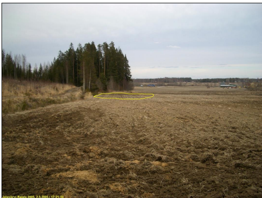
Kvartsi-iskoksia Arkkuvuoren asuinpaikalta

Asuinpaikan arvioitu ala merkitty kuvaan keltaisella viivalla. Kuvattu koilliseen, alarinteeseen.